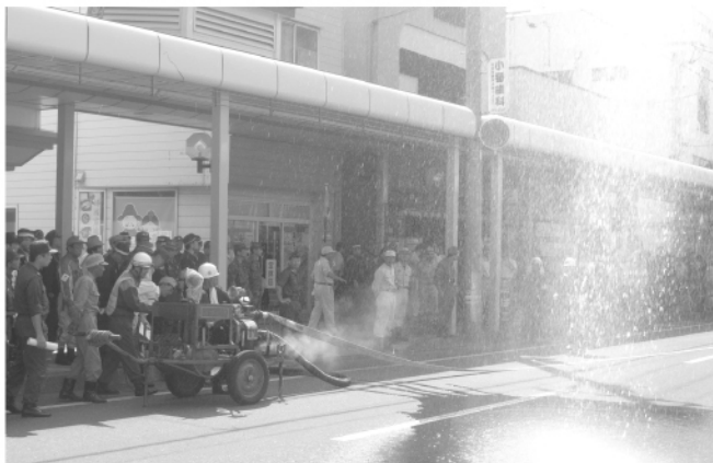
商店街での初期消火訓練