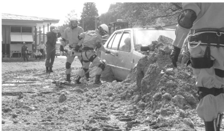
土砂に埋もれた車両からの救助訓練

東北管区警察局、陸上自衛隊第二十一普通科連隊、航空自衛隊秋田救難隊、国土交通省東北地方整備局、湯沢雄勝広域市町村圏組合消防本部を含む七十機関・