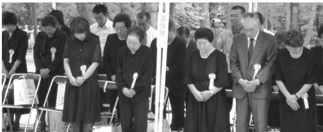
御 遺 族

消防学校生により毎年行われている殉職消防職団員招魂碑の清掃を、今年も八月二十八日の慰霊祭を前に八月二十五日にやっ て頂いた。消防学校では、情操教育の一環として行っていることだが、真夏の暑い最中、碑内の玉石を全部移動しての枯れ 葉やゴミの除去、碑の側面に付着したコケ の除去、碑全体の洗い流し作業などで第六 十二期生六十一名は汗だくでくであった。 ありがとうございました。 終わりに、学生は今日の消防の充実発展 の礎を築いた殉職者にこれからの自らの精 進と安心安全な社会のあり様を祈った。