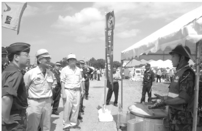
応急給水・吹き出し訓練