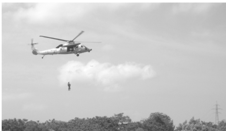
河川の増水による救出訓練